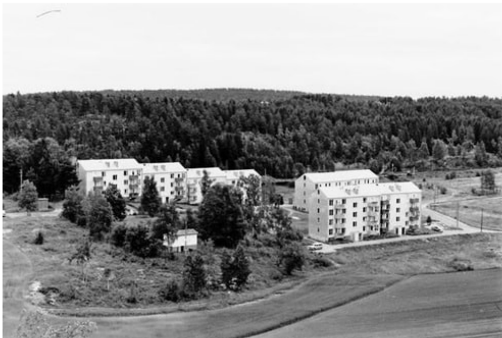
De første blokkene på Holmlia