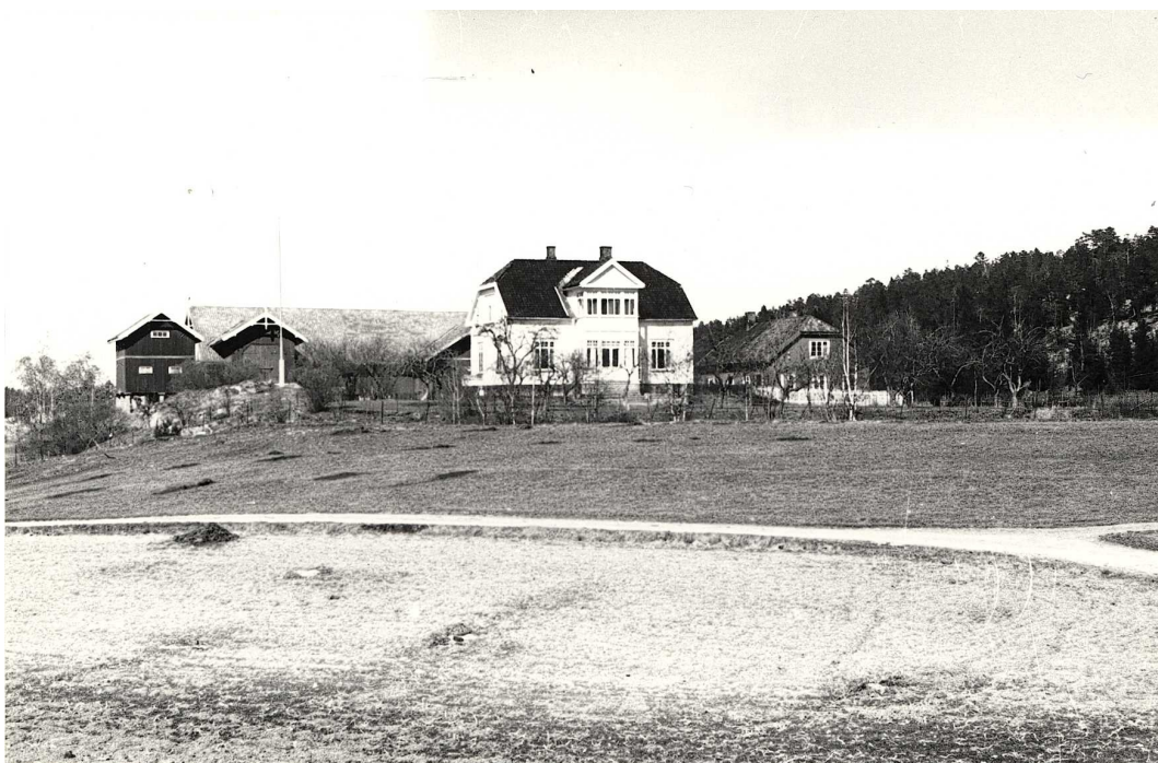
Holm gård 1941