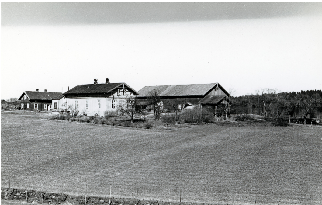
Søndre Ås gård Foto: Anders Beer Wilse, 1941

Dette er det opprinnelige tunet på Ås, gården ble delt i 1849.