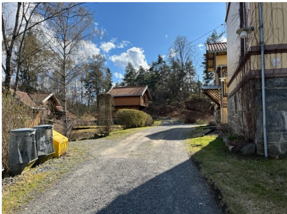
Tunet på Store Ljan gård

Tunene på Store Ljan og Søndre Ås er bevart, på Nordre Ås står våningshuset og stabburet igjen av de bygningene som kan sees på bildet fra 1941, 34 men på Holm er alle bygningene borte. På Øvre Ljan har det ikke vært noe kjent gårdstun etter svartedauden. Hovedbygningen på Store Ljan ble rehabilitert utvendig for noen få år siden. Deler av bygningen antas å være fra første halvdel av 1700-tallet. Hvis dette er riktig, så er det fremdeles bygningsdeler der fra tiden da Christian Fredrik Jensen flyttet til gården i 1753 eller 1754. Senere har det vært flere til- og ombygginger på hovedbygningen. I dag er bygningene både på Store Ljan og Søndre Ås vernet etter plan- og bygningsloven. Uthusene på Store Ljan (låve, stabbur og vognskjul/garasje) ble satt fint i stand av det lokale heimevernet (Nordstrand HV) litt ut på 1980-tallet, dette var i forbindelse med at de da fikk disponere disse bygningene av kommunen. Heimevernet hadde tidligere disponert et hus på eiendommen Rosenholm på Holmlia, men dette ble revet i forbindelse med utbyggingen i området.