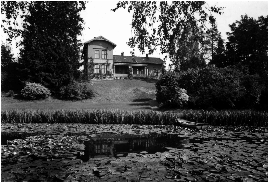
Store Ljan gård