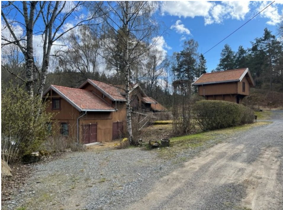
Låven og stabburet på Store Ljan gård Foto: Gunnar Hauger, april 2023

Vognskjulet/garasjen ligger et stykke bak (sør for) stabburet.