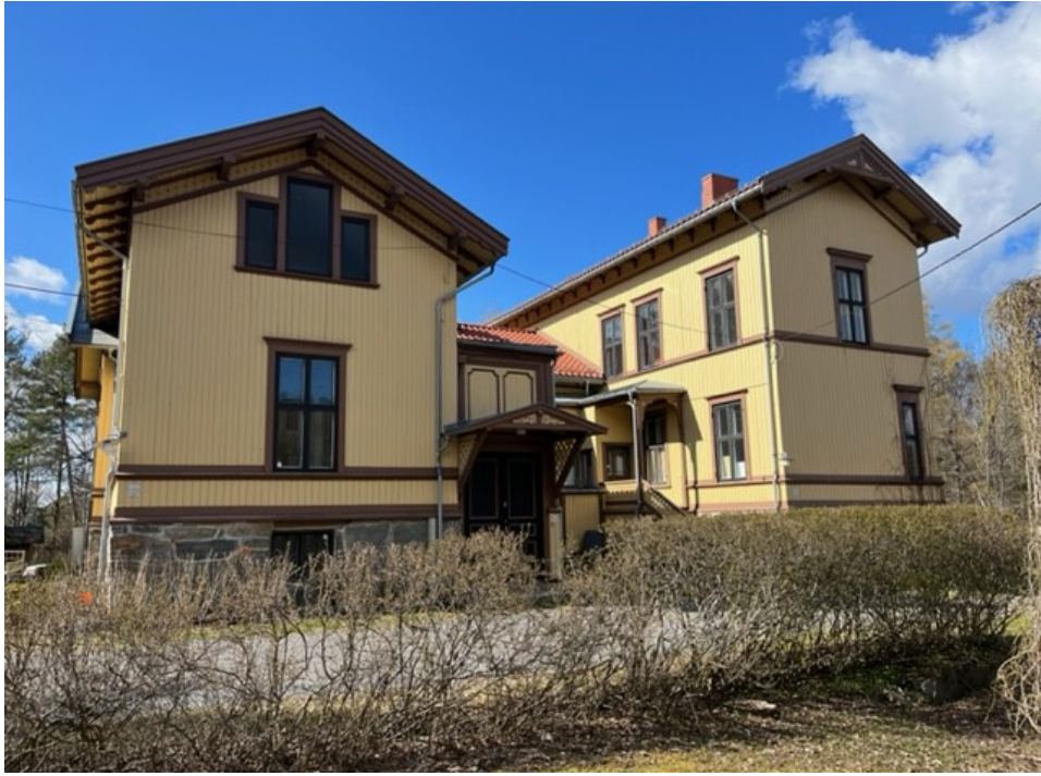
Våningshuset på Store Ljan gård Foto: Gunnar Hauger, april 2023