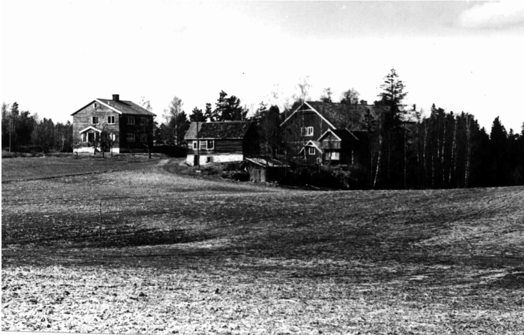
Nordre Ås gård