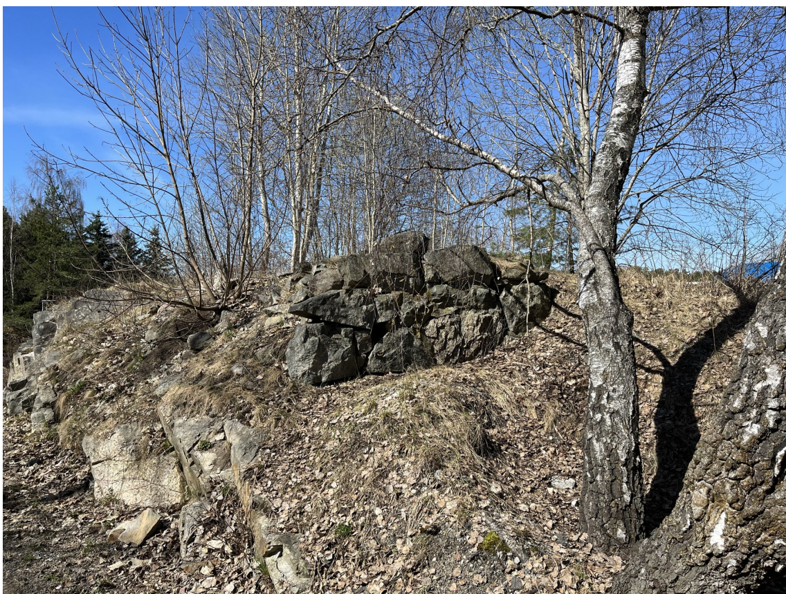
Murrester etter det opprinnelige grisehuset på Holm Foto: Gunnar Hauger, april 2023

I dag er det som tidligere nevnt ikke mange fysiske spor igjen etter Holm gård. Men det står igjen noen få kvadratmeter med steinmur fra det opprinnelige grisehuset på gården (fra den sørøstre delen) som senere ble benyttet til kontor og bolig. Den ligger rett på nordsiden av gangveien som går bak bensinstasjonen. Hvis man går vestover, kan den sees like etter at bensinstasjonen er passert.