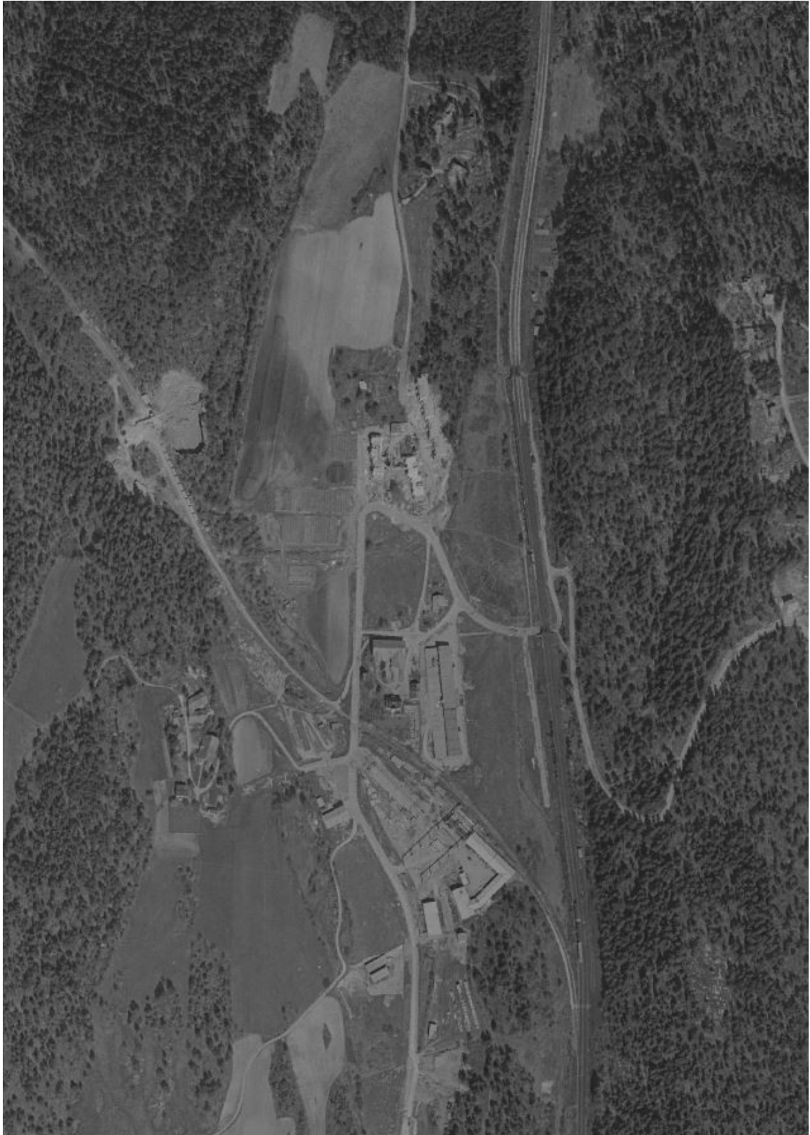
Flyfoto fra 1956 over Holm gårds grunn