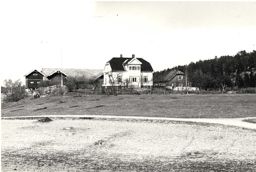
Holm gård, bildet er tatt mot nord/nordøst. Her sees våningshuset, bryggerhuset, stabburet og driftsbygningen