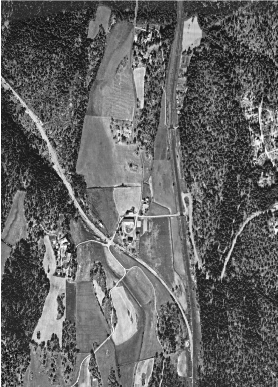
Flyfoto fra 1947 over Holm gårds grunn