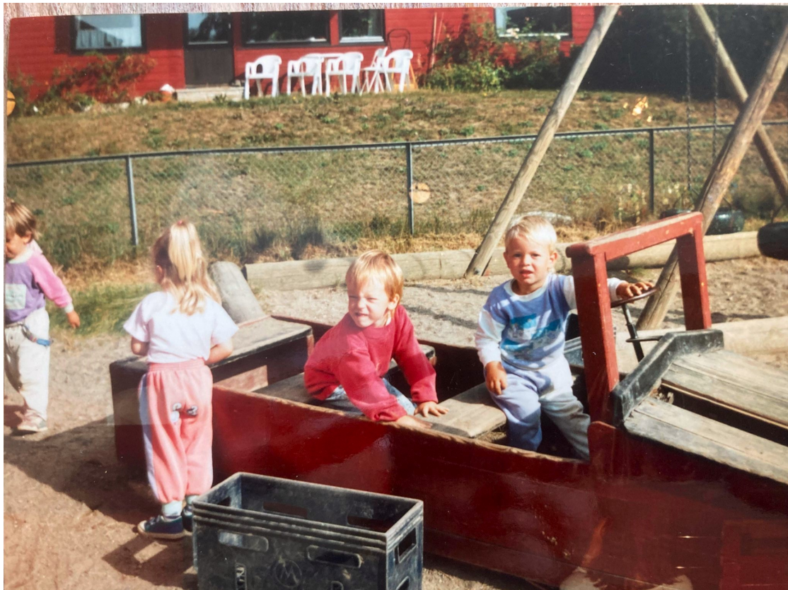
Skovbakken barnepark da barna lekte og hadde det gøy!